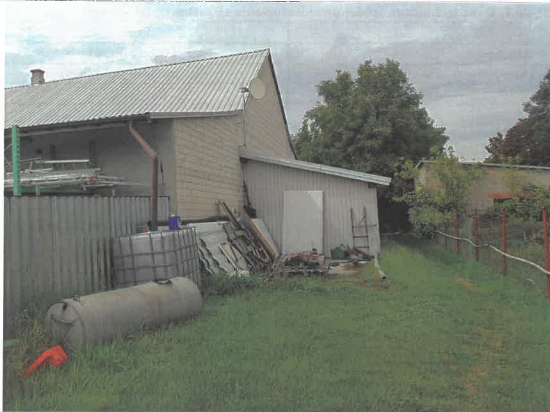
Fot. 1. OM Bramki / ul. Długa 9 – widok anteny linii radiowej na dachu budynku