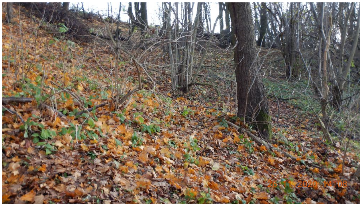
Fragment górnej części osuwiska i skarpy głównej