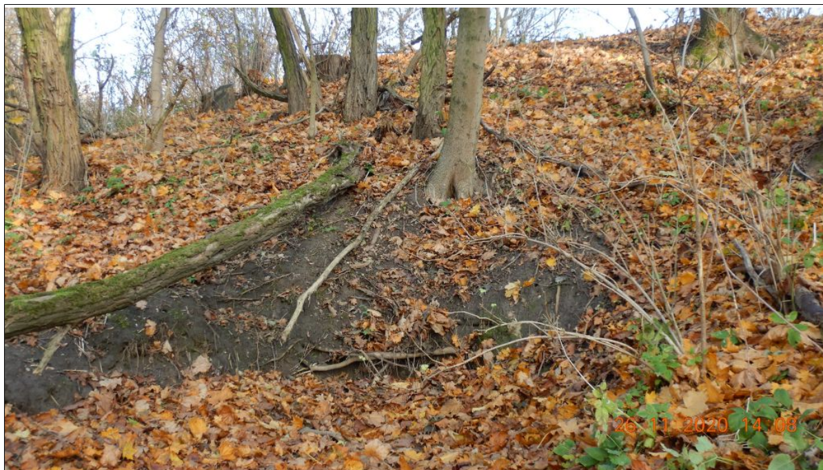
Morfologia koluwium osuwiska z widocznymi aktywnymi częściami