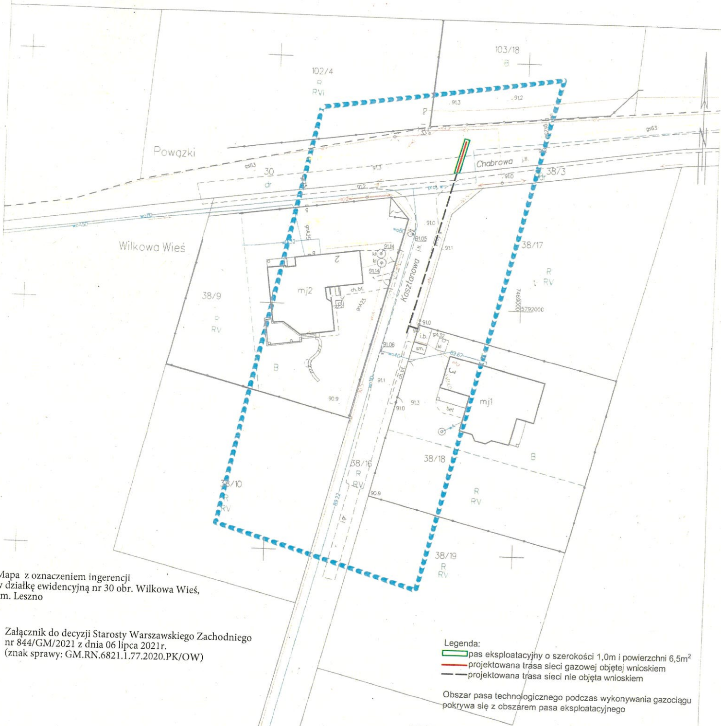
Mapa z oznaczeniem ingerencji w działkę ewidencyjną nr 30 obr. Wilkowa Wieś, gm. Leszno

Sekcje mapy: 7.174.17.16.2.1; 7.174.17.11.4.3 Układ odniesienia: PL-ETRF89, układ wsp. płaskich: PL-2000 strefa 7 (21°), układ wys.: PL-EVRF-2007-NH OD.6640.1.4091.2020