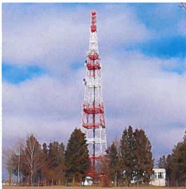
Fot. 1. SLR Kampinos – widok obiektu