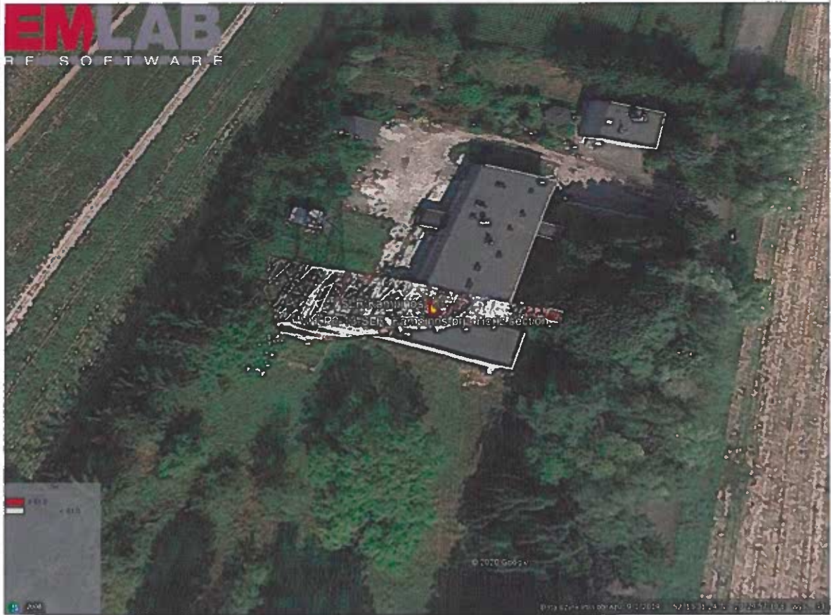
Rys. 2. Rzut poziomy rozkładu pola elektromagnetycznego anteny nowo projektowanej linii radiowej w otoczeniu SLR Kampinos przewidzianej do zainstalowania na wysokości 60 m nad poziomem terenu.